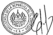
ELÍAS ANTONIO SACA GONZÁLEZ PRESIDENTE DE LA REPÚBLICA DE EL SALVADOR

Primero. PRORRÓGASE , el plazo del Contrato por Suministro de Servicio, Código: CSS/LP/005/2008/PR-SC, cuyo objeto se denomina: "Publicidad para la Presidencia de la República, brindada por agencia especializada", por un período de SESENTA Y NUEVE DÍAS más, contados a partir del día uno del mes de enero al día diez del mes de marzo, ambas fechas del año dos mil nueve; Segundo. El pago correspondiente a la presente prórroga podrá ascender hasta la cantidad de QUINIENTOS NOVENTA Y TRES MIL DÓLARES DE LOS ESTADOS UNIDOS DE AMÉRICA (US $593,000.00), el cual será cancelado por la Presidencia de la República a la Contratista, en la forma originalmente pactada, en las oficinas de la Contratante, ubicadas en Alameda "Doctor Manuel Enrique Araujo", número cinco mil quinientos de esta ciudad, treinta días calendario después de la presentación de la respectivas facturas a cobro. Para cancelar tales pagos existe disponibilidad de recursos; y, Tercero. NOTIFÍQUESE .