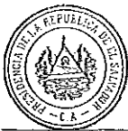
ELÍAS ANTONIO SACA GONZÁLEZ POR "LA PRESIDENCIA"

XIX.- NOTIFICACIONES. Todas las notificaciones referentes a la ejecución del presente Contrato, serán válidas solamente cuando fueren hechas por escrito a las direcciones de las partes contratantes. Para tal efecto, las partes señalan como lugares para recibir dichas notificaciones, los siguiente: "LA PRESIDENCIA", en Barrio San Jacinto, final Avenida los Diplomáticos y Calle México, San Salvador; y "LA CONTRATISTA", en Avenida el Almendro, número ciento once, Colonia Maquillishuat, de esta ciudad. Así nos expresamos los comparecientes, quienes enterados y conscientes de los términos y efectos legales del presente Contrato, por convenir así a los intereses de nuestras representadas, ratificamos su contenido, en fe de lo cual firmamos en la CIUDAD DE SAN SALVADOR, A LOS VEINTICUATRO DÍAS DEL MES DE OCTUBRE DEL AÑO DOS MIL OCHO.-