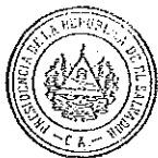
ELÍAS ANTONIO SACA GONZÁLEZ POR "LA PRESIDENCIA"

presente año. El plazo de entrega del suministro de mérito iniciará en la fecha de recibo por parte de la Contratista, de la notificación de la "ORDEN DE PEDIDO DEL SUMINISTRO", extendida por la Institución a través de la Unidad de Adquisiciones y Contrataciones Institucional de la Presidencia de la República. El plazo de vigencia del Contrato podrá prorrogarse de conformidad a los artículos ochenta y tres, ochenta y seis, y noventa y dos inciso segundo de la LACAP; y a las estipulaciones contenidas en el Contrato. Y yo, el suscrito notario, DOY FE: de ser auténticas las firmas puestas al pie del documento en mención, por haber sido reconocidas como suyas a mi presencia por los otorgantes, quienes manifiestan además su conformidad con los conceptos vertidos en el mismo. Así se expresaron los comparecientes, a quienes expliqué los efectos legales de la presente Acta Notarial, que consta en tres hojas de papel simple. Y leído que les hube íntegramente todo lo escrito, en un solo acto sin interrupción alguna, me continúan manifestando los comparecientes que entienden sus efectos, que ratifican todo lo escrito por estar redactado conforme a sus voluntades y que para constancia firman conmigo. DOY FE.-